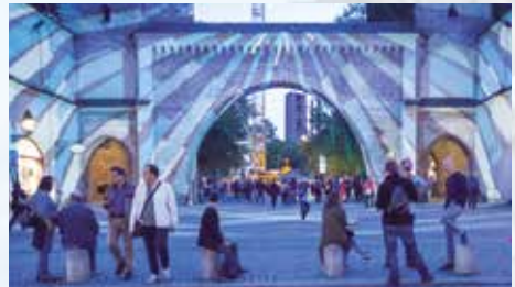
Sendlinger Tor 2019

Das Münchner Beispiel machte Schule. Heute gibt es in jeder größeren Stadt Fußgängerbereiche, die zum Bummeln, Flanieren, Shoppen oder zum Verweilen einladen. Auch wenn sich in den letzten 50 Jahren in der Münchner Innenstadt viel verändert hat, so ist die „Münchner Mischung“ aus Handel, Gastronomie, Dienstleistern, Kultureinrichtungen und prägenden Kirchen, die es so in keiner anderen Stadt gibt, immer noch einmalig. Hier finden sich kleine, inhabergeführte Geschäfte und große Kauf- und Warenhäuser, internationale Labels, Münchner Tradi-